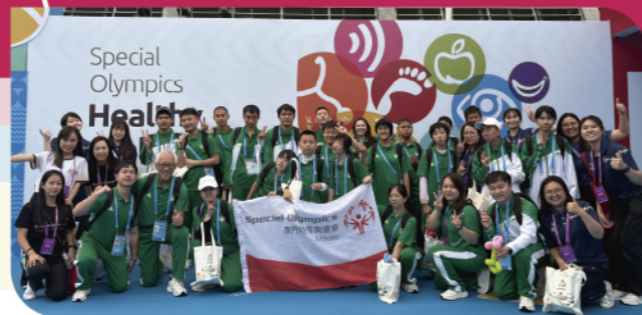
參訪團與澳門特奧田徑隊在中山體育館 「健康運動員計劃」篩查現場合照

全國第十二屆殘疾人運動會暨第九屆特殊奧林匹克運動會舉行期間，除了賽場上激烈的競技外，賽場下非體育類項目同樣進行得如火如荼。本次殘特奧會的「兩活動一計畫」項目由中國殘聯和中國特奧委員會發起，在廣東省中山市展開。項目內容包括「特奧家長交流活動」、「特奧青少年融合交流活動」和「特奧健康運動員計劃」，以「融愛同行 健享未來」為共同主題，旨在透過一系列的活動促進特奧青少年的成長和凝聚社會對家庭的支持。