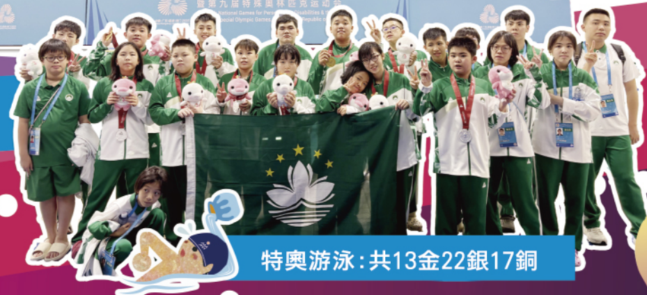
特奧游泳：共13金22銀17銅