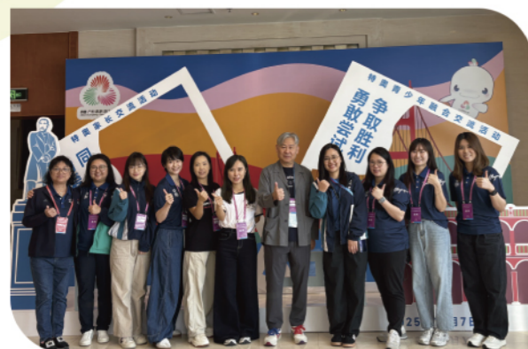
參訪團在中山金鑽酒店「兩活動一計畫」 啟動儀式現場合照

為了積極支持「兩活動一計畫」項目，本會特別派出參訪團於12月7日到中山觀摩相關項目的開展。參訪團由特奧臨床總監、金沙中國關懷大使義工和專職同工組成，除了參與啟動儀式外，更到達位於中山體育館副館的「特奧健康運動員計劃」篩查現場。本會參訪團與國際特奧東亞區區域總裁兼總經理馮美孫及其團隊會面交流，另一方面也積極去到每一個篩查站點進行觀摩學習，更陪同於中山賽區的澳門特奧田徑隊運動員進行健康篩查，期望將寶貴的經驗帶回澳門，進而優化日後由本會開展的「特奧社區－關愛健康計劃Healthy Athletes®」。