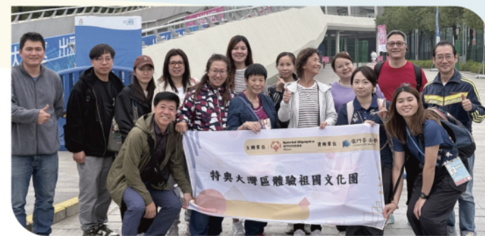
特奧大灣區體驗祖國文化團一家長及理事大合照

澳門特殊奧運會主辦、澳門基金會資助的「特奧大灣區體驗祖國文化團」於12月10日至11日順利舉辦。活動組織本會骨幹成員及參賽運動員家長前往大灣區，觀摩全國第十二屆殘疾人運動會暨第九屆特殊奧林匹克運動會，展開為期兩天一夜的文化交流。團員走訪江門中心體育館和中山興中體育場，為本會參賽運動員加油鼓勵，見證他們在賽場上奮力拼搏、揮灑汗水的動人時刻。