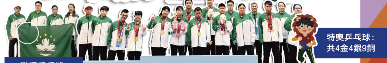
特奧乒乓球：共4金4銀9銅