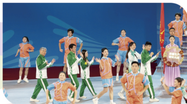
澳門特殊奧運會部份代表團出席全國第十二屆殘疾人運動會暨第九屆特殊奧林匹克運動會閉幕式