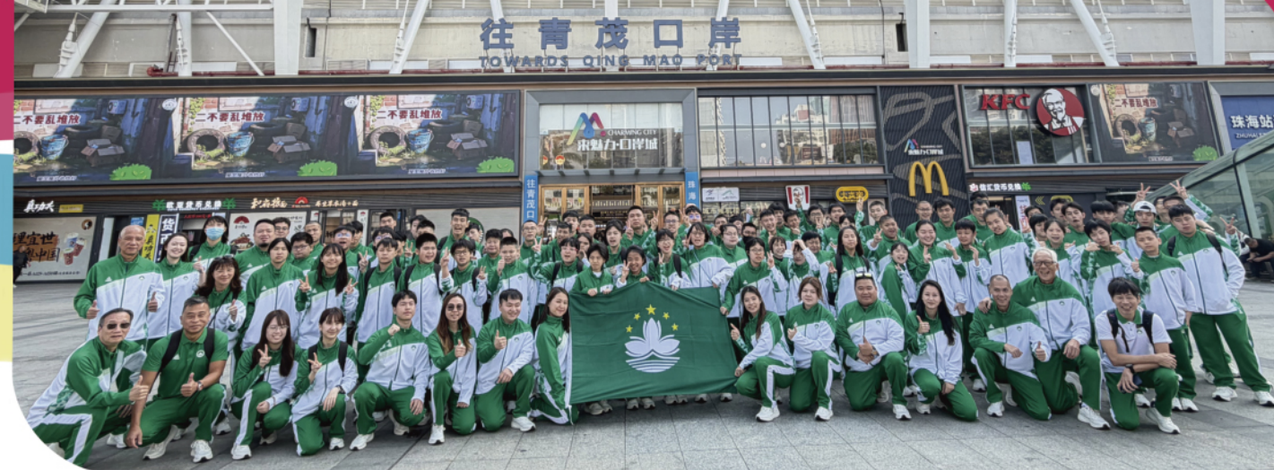
澳門運動員代表團出賽全國第十二屆殘疾人運動會暨第九屆特殊奧林匹克運動會