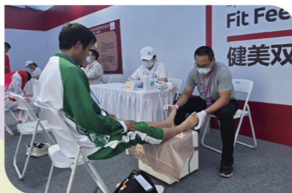
由醫療義工為澳門特奧會田徑運動員作足部健康檢查