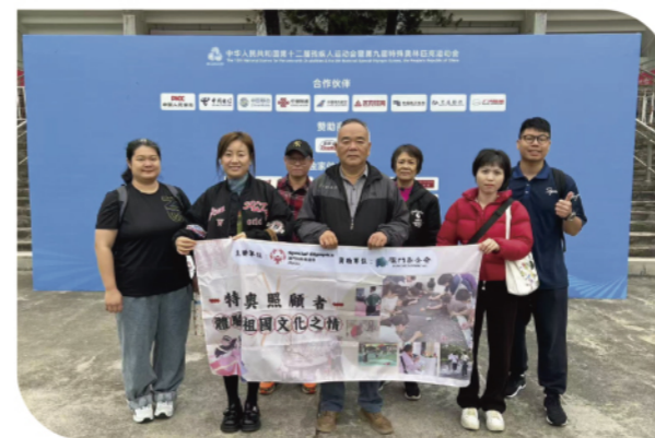
特奧照顧者體驗祖國文化之情團大合照

澳門特殊奧運會主辦、澳門基金會資助的「特奧照顧者體驗祖國文化之情」於12月13日至14日順利舉辦。活動組織參賽學生家長及啟智學校代表前往大灣區，觀摩全國第十二屆殘疾人運動會暨第九屆特殊奧林匹克運動會。行程中，家長與學校代表通過觀賽及互動，更深入了解學生的狀態與表現；同時，出訪的照顧者亦與來自不同地區的持份者（包括各地領隊、教練及家長）展開交流，藉此深入了解不同地區殘疾人士在生活、文化、體育等多