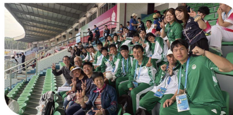
團員們與田徑隊員及教練大合照

此次行程中，團員不僅親身感受到本屆全國殘特奧運動員在賽場上奮勇拼搏的精神，也透過實地考察，深入了解了本屆賽事的無障礙設施。大家深受啟發，並期望未來本會運動員也能藉此參賽機會。