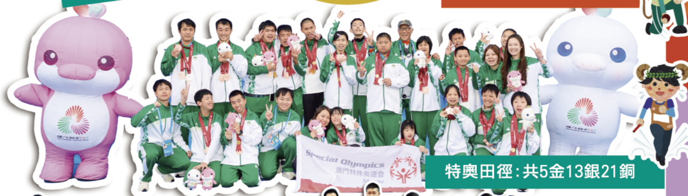
特奧田徑：共5金13銀21銅