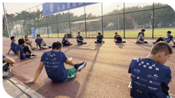
澳門特殊奧運會運動員的訓練時刻

代表團的成功出征並獲得佳績，離不開澳門特別行政區政府體育局的全力支持與資助，除此也有社會各界的支持和幫助，當中包括下列的機構及單位：金沙中國、永利澳門有限公司、盛世集團、澳門自來水、澳門彩票有限公司、張權破痛油、粵澳兩地牌車友會、澳門消防退休人員協會、澳門電訊、澳設體育服及制服有限公司、陳光記、Deckers Asia Pacific Limited、HOKA、影匠影視製作有限公司等社會各界與商企的慷慨贊助，為代表團提供了從裝備、制服到交通、後勤等全方位的保障。這不僅是物質上的幫助，更傳遞了一份深厚的社會關愛與鼓勵，極大地提振了全體隊員的士氣，成為運動員最堅實後盾。