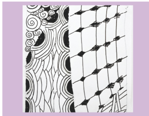
《旋渦與格網的對話》

出自「無限∞融合藝術系列活動」，花朵以不同層次的藍色和白色描繪，搭配著綠葉與點點白色飛濺，花朵漂浮在宇宙中，充滿詩意和夢幻氛圍。由於藍玫瑰難以自然培育，就像藍玫瑰的花語：象徵夢幻與奇蹟，看似在不可能中將誕生美好與希望。